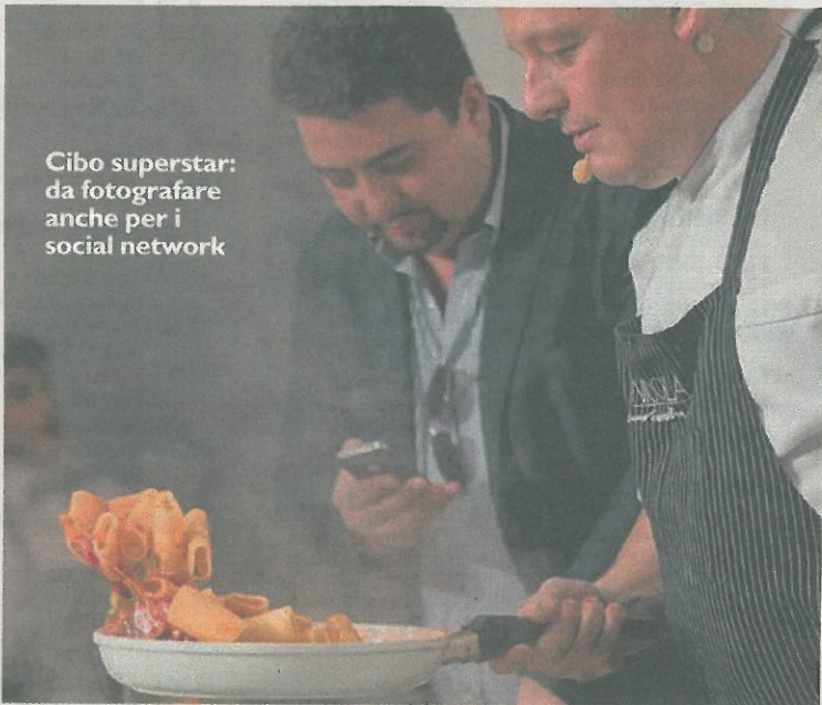
Cibo superstar: da fotografare anche per i social network